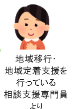
地域移行・地域定着支援を行っている相談支援専門員より

病院⇒地域へ…担当ソーシャルワーカーさんからのバトンを引き継いでいけるよう、まずは患者さんとの信頼関係を十分に構築しながら関わりを深めていきます。退院場所決定以外にも『地域っていいな』と思えるような情報提供をしたいです。